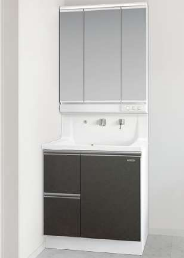
W750mm×D600mm×H800mm ※写真はイメージです。